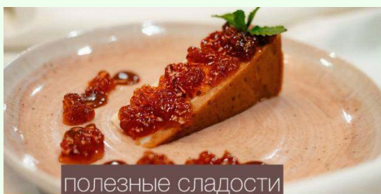
полезные сладости местные ягоды

В гастрономических приемах: треска, палтус, краб, еж, местная дичь (по запросу), наливки на северных ягодах, ПП десерты из местных ягод, саамское печенье из древесной коры.